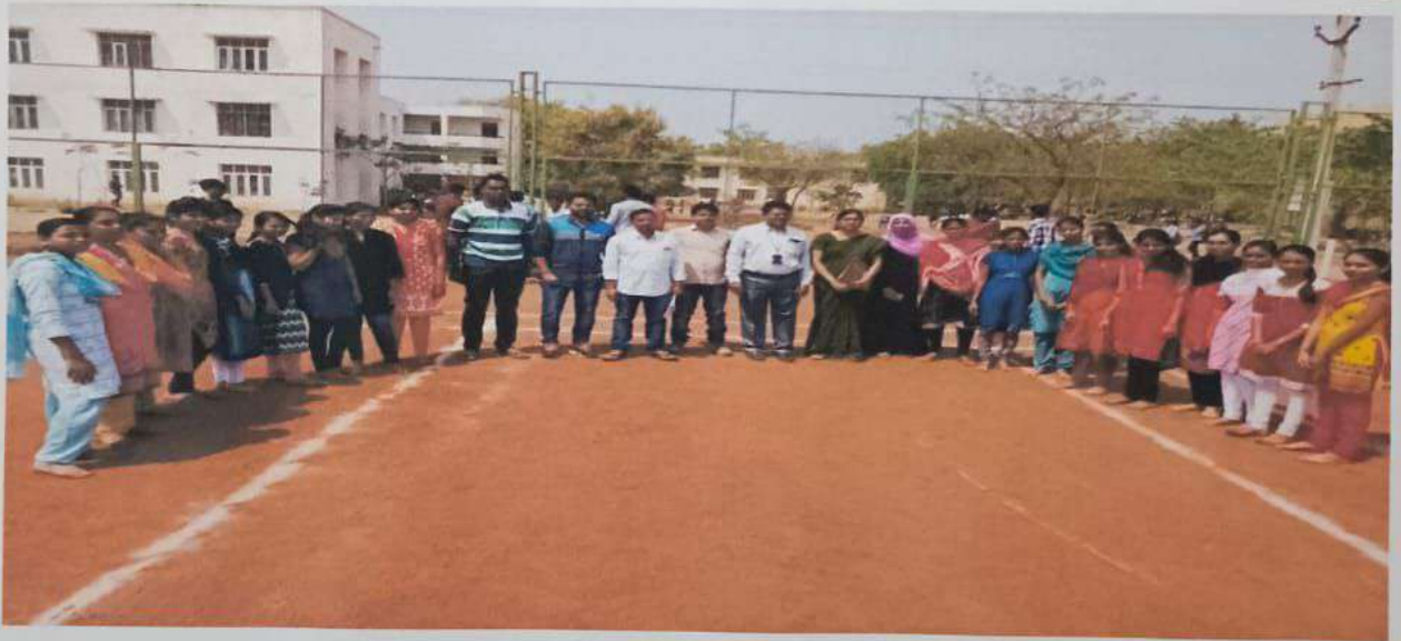
Pharma Ustav: Sports and Games competitions for girls and boys