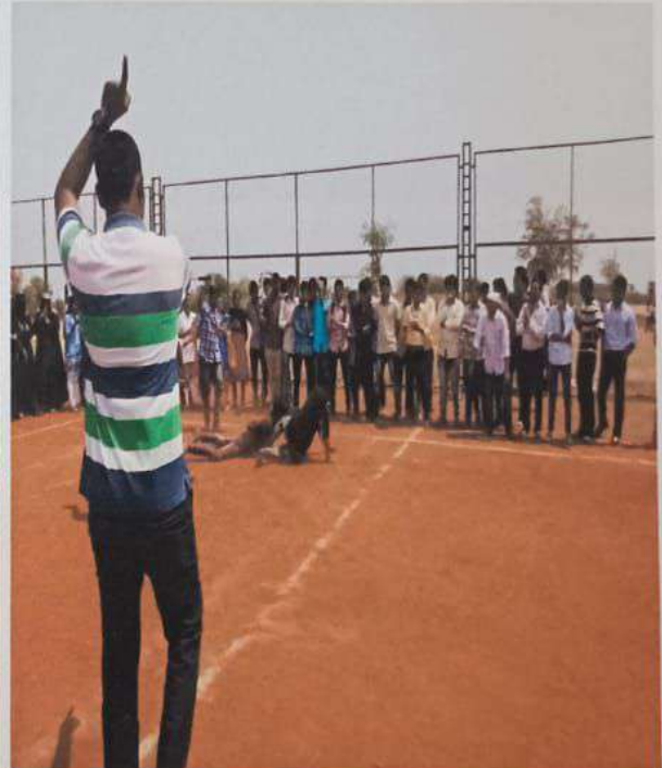
Pharma Ustav: Sports and Games competitions for girls and boys